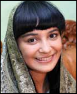
Shireen Sungkar Bercita-cita Dirikan Sekolah Gratis untuk Anak Yatim