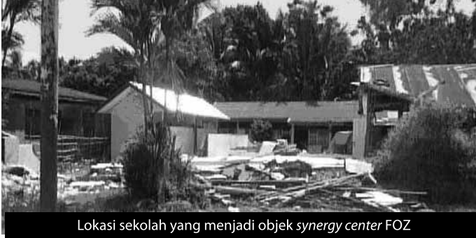
Lokasi sekolah yang menjadi objek synergy center FOZ