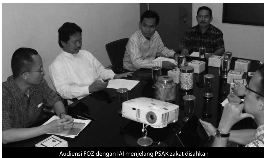
Audiensi FOZ dengan IAI menjelang PSAK zakat disahkan

Keempat , zakat yang disalurkan ke yayasan lain itu boleh dan dimungkinkan. Selama yayasan tersebut sudah terpisahkan