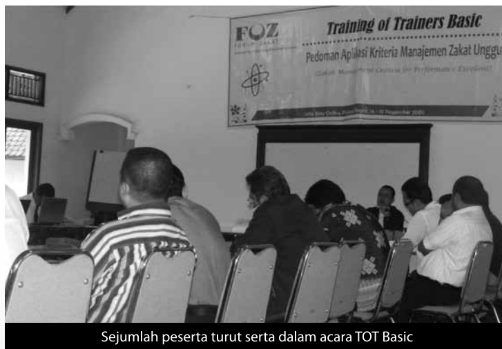
Sejumlah peserta turut serta dalam acara TOT Basic

Selama tiga hari mulai tanggal 16 – 18 Nopember 2009, sebanyak 23 peserta perwakilan organisasi pengelola zakat di Indonesia mengikuti acara Training of Trainers (ToT) Basic di Vila Bina Qolbu, Puncak, Bogor, Jawa Barat. Acara ini diselenggarakan oleh FOZ seiring telah selesainya buku Pedoman Aplikasi Kriteria Manajemen Zakat Unggul yang disusun oleh tim penyusun Standarisasi Mutu.